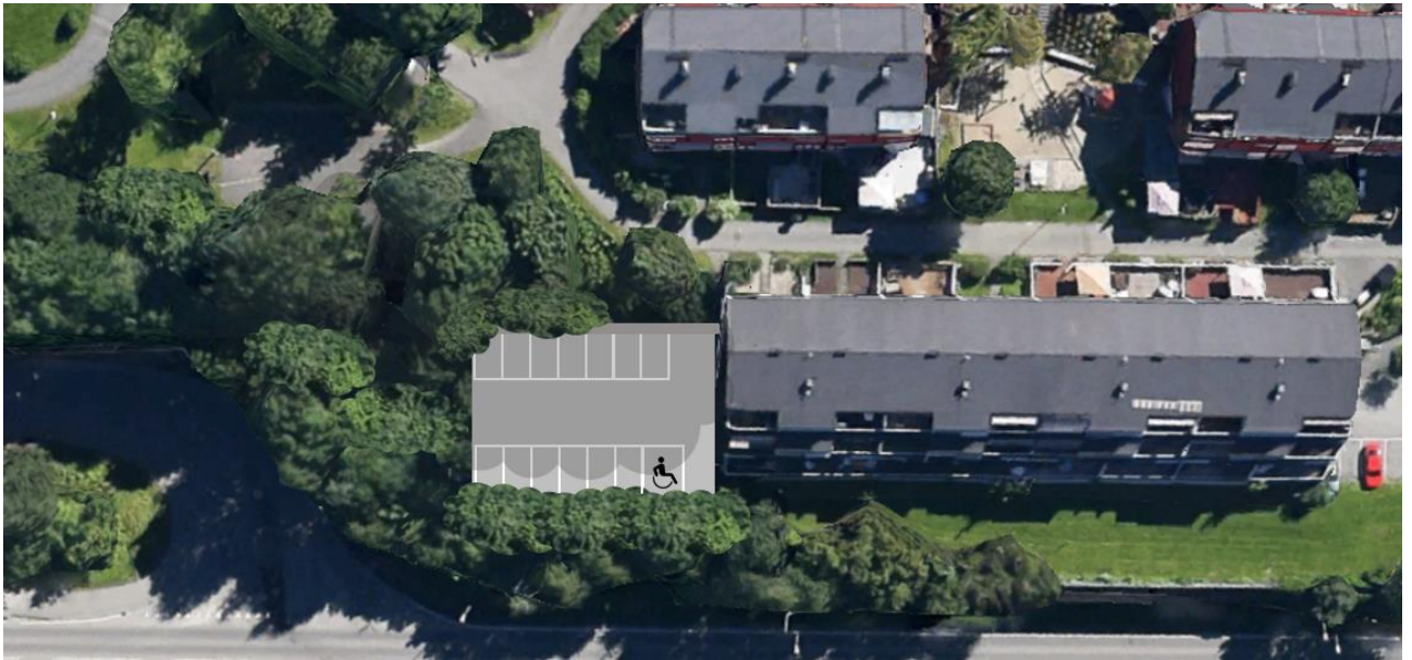
Figur 7: Alternativ 3 a - viser ny parkeringsløsning

Arealinngrep: Etablering av nytt parkeringsdekke, fjerning av trær, åpning av eksisterende vegg i parkeringskjeller, mulig behov for støttemur og trapp/tilkomst til arealet.