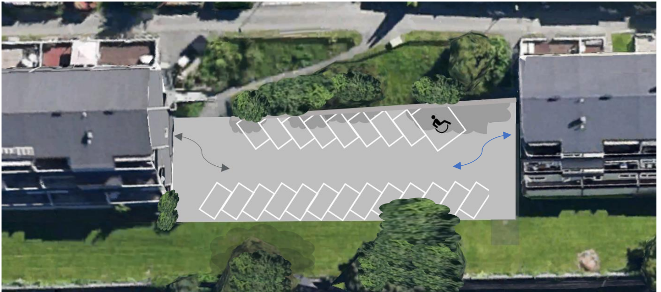
Figur 5: Alternativ 2 a - viser ny parkeringsløsning

Arealinngrep: Parkeringsplassen er noe utvidet, mulig behov for støttemur.