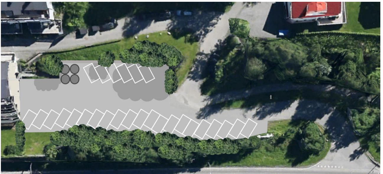
Figur 4: Alternativ 1 b- viser ny parkeringsløsning

Arealinngrep: Parkeringsplassen er noe utvidet, mulig behov for støttemur.