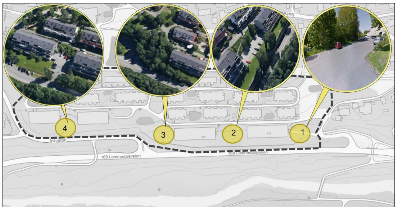
Figur 2: Viser de ulike alternativene for parkeringsutvidelse