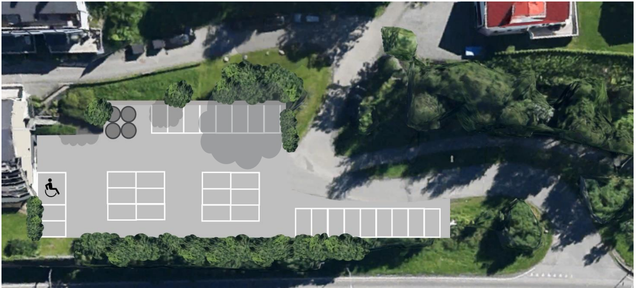
Figur 3: Alternativ 1 a – viser ny parkeringsløsning

Arealinngrep: Parkeringsplassen er noe utvidet, mulig behov for støttemur.