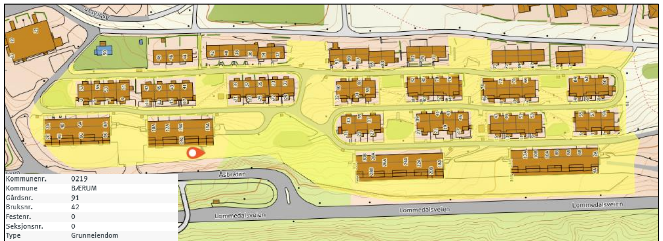
Figur 1: Viser grunneiendommen for Løkenhavna boligsameie